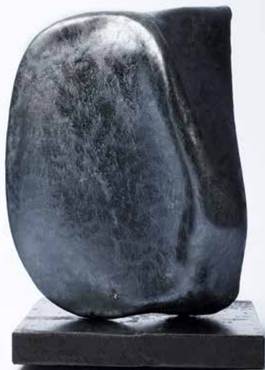
“Steen”, samengestelde platen, zwart metallic glazuur, 15x15x25 cm

Ipomal galerie en kunstuitleen Charles Frehenstraat 5 6374 EK Landgraaf NL 0031 (0)45-5323619 info@ipomal-galerie.nl www.ipomal-galerie.nl http://www.facebook.com/ipomalgalerie/