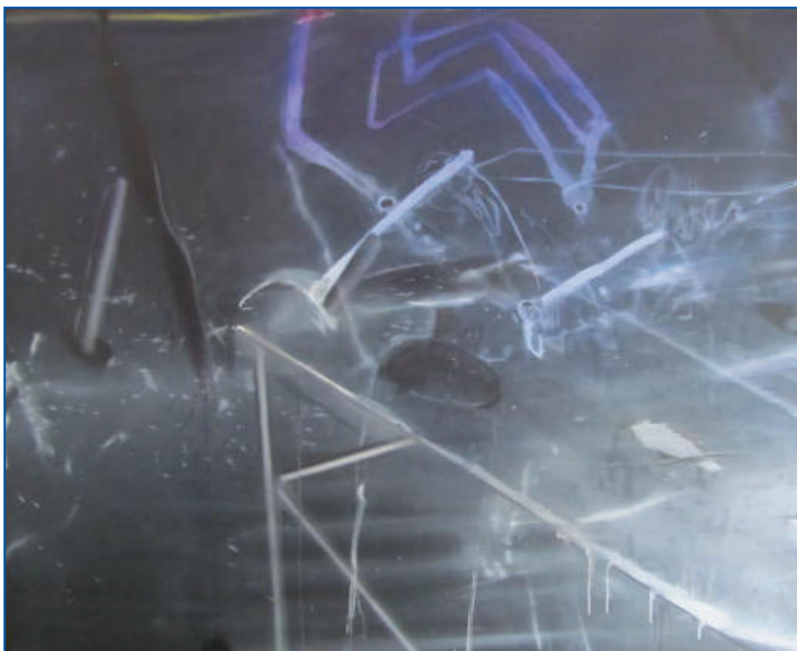
Lukas Kramer, Bahre , acryl op doek, 121x152 cm

Ipomal galerie en kunstuitleen Charles Frehenstraat 5 6374 EK Landgraaf NL 0031(0)45-5323619 info@ipomal-galerie.nl www.ipomal-galerie.nl